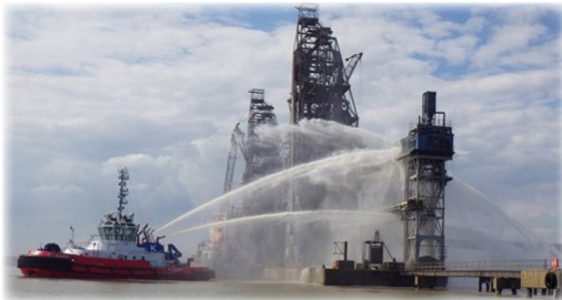
Изображение 1: Тушение пожара на конвейере

Из-за неисправности подшипника на конвейере крупного лондонского портового терминала для импорта и экспорта зерна произошел сильный пожар. Огонь распространился на соседнее оборудование и причинил ущерб на сумму в несколько сотен тысяч фунтов стерлингов.