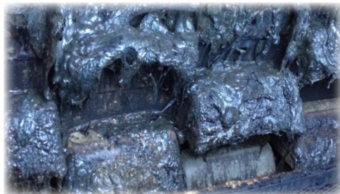
Изображение 3: Поврежденные ковши соседней нории