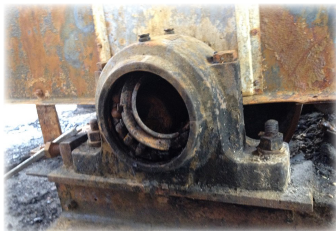
Imagem 2: Rolamento em falha; causa do incêndio

A autoridade portuária precisava que as soluções fossem aprovadas pela ATEX, compatível com o industry 4.0 e a IoT industrial para tornar o investimento com futuro assegurado e expansível.