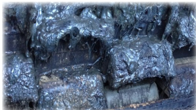
Imagem 3: Baldes danificados do elevador adjacente