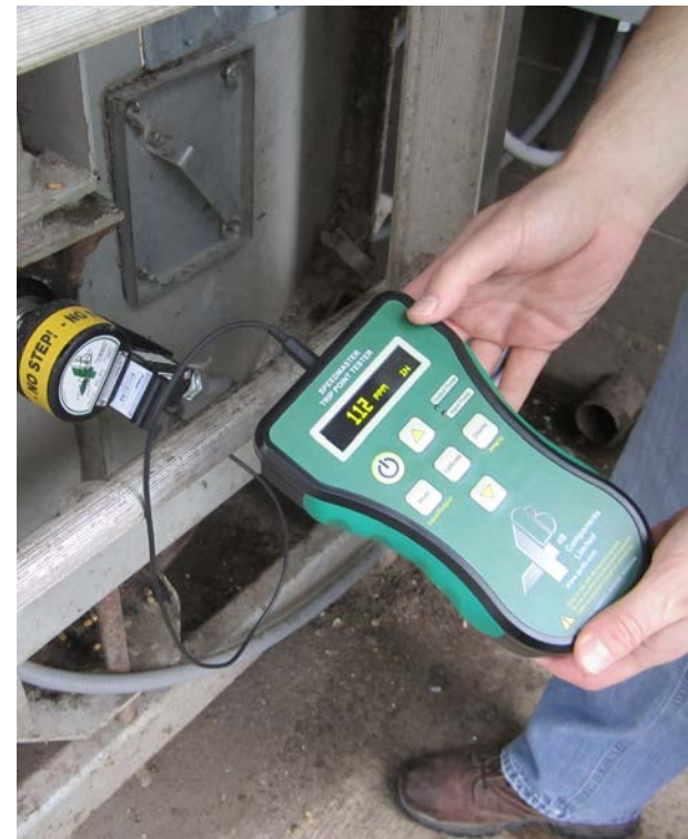
4B Speedmaster - dispositivo de pruebas para sensores de velocidad

Una gran cooperativa del medio oeste de EE. UU. había crecido considerablemente de forma orgánica y mediante fusiones y adquisiciones. El equipo de gestión de la cooperativa puso en marcha un plan de mejora de las operaciones con el que también quería actualizar el sistema de supervisión de riesgos de la empresa para mejorar la seguridad, el tiempo de actividad y la fiabilidad. La empresa cuenta con una gran cantidad de instalaciones, grandes y pequeñas, viejas y nuevas, de pienso, grano, molienda y fertilizantes, con varios niveles de automatización y requisitos de supervisión. Las más de 60 plantas de la cooperativa están a cientos de kilómetros de distancia, por lo que la fiabilidad, la testabilidad de las operaciones, el acceso remoto, y el soporte era requisitos clave. Para la cooperativa, el gran desafío era encontrar un solo proveedor que pudiera cumplir todos esos requisitos a la vez.