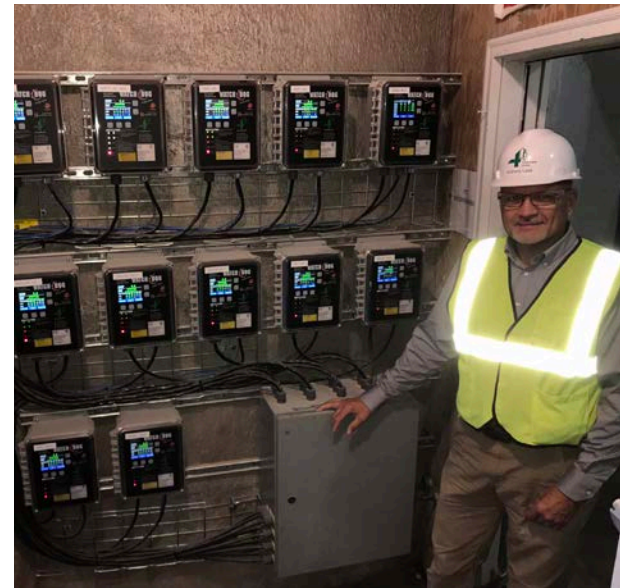
Varios Watchdog Super Elite y sistemas Ethernet industriales Flex-Net instalados en la sala de control de una de las plantas

La empresa estaba utilizando sistemas de supervisión de riesgos de al menos seis fabricantes distintos en sus plantas, por lo que ya estaba familiarizada con varios posibles proveedores. Tras una exhaustiva fase de investigación, consulta y análisis, la empresa eligió a 4B Components Ltd. como proveedor predilecto. Las innovadoras soluciones de alta calidad de 4B que se utilizaron fueron: sensores de la velocidad del transportador, temperatura de los cojinetes, alineación de la correa, detección de obstrucciones, holgura de la cadena y posición de las compuertas; controladores de supervisión de riesgos Watchdog Super Elite para control local y despliegue rápido; nodos Ethernet industriales Flex-Net para conectividad de sensores remotos; HazardMon.com para supervisión en la nube; y herramientas de prueba y ensayo para realizar pruebas 100 % funcionales y verificar los sensores y controladores. Además de proporcionar hardware electrónico, 4B visitó todas las plantas con el fin de evaluar los sistemas existentes y recomendar las actualizaciones pertinentes para garantizar el éxito de las operaciones de supervisión. 4B también inspeccionó la instalación y realizó la puesta en servicio de los sistemas, y también fue 4B quien proporcionó la formación necesaria sobre los productos al personal y la gestión de la planta.