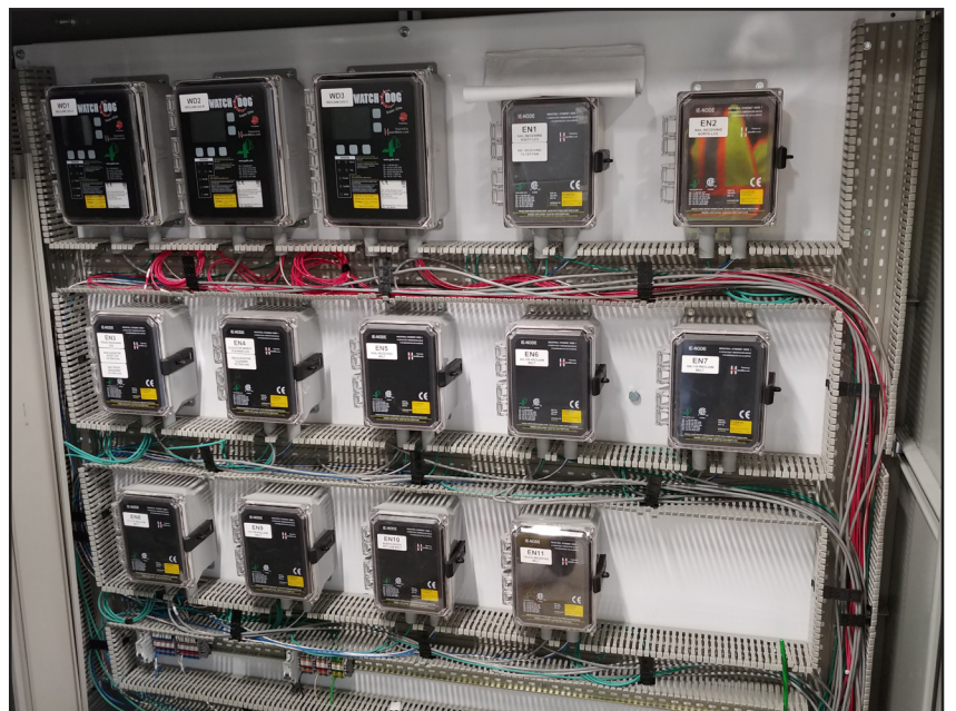
Schalttafel mit IE-Knoten