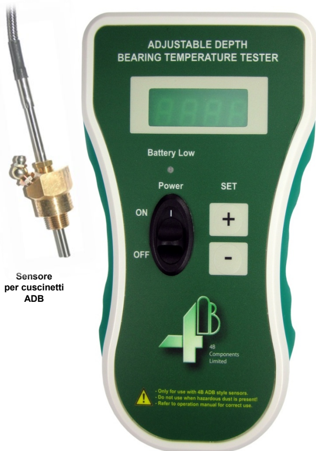
Tester manuale ADB